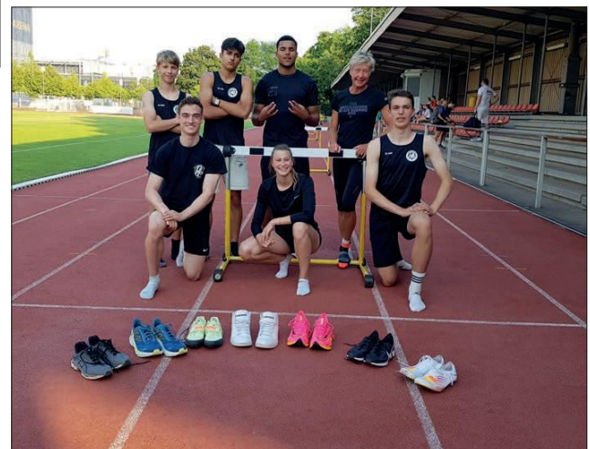
Nicht nur die Leichtathleten machen im TVA Furor. Auch andere Abteilungen konnten in den vergangenen Monaten tolle sportliche Erfolge einfahren.